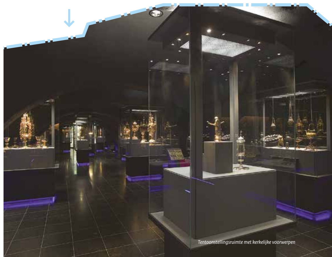
Tentoonstellingsruimte met kerkelijke voorwerpen

De ingevulde formulieren dient u in bij de CDIU, vergezeld van de benodigde herkomstgegevens en (foto)documentatie. Aan de hand van het volledig ingevuld formulier dat de CDIU ontvangen heeft, bepaalt de Erfgoedinspectie of de voorwerpen inderdaad vergunningplichtig zijn. Zo nee, dan wordt u daarvan op de hoogte gesteld. Er wordt nagegaan of de goederen tot het beschermd cultuurbezit van Nederland of een andere lidstaat behoren. De douane en de Erfgoedinspectie kunnen eisen dat een voorwerp voor de vergunningverlening wordt gecontroleerd. Wanneer er geen bezwaar bestaat tegen de uitvoer, verstrekt de CDIU op basis van het aanvraagformulier een uitvoervergunning in tweevoud.