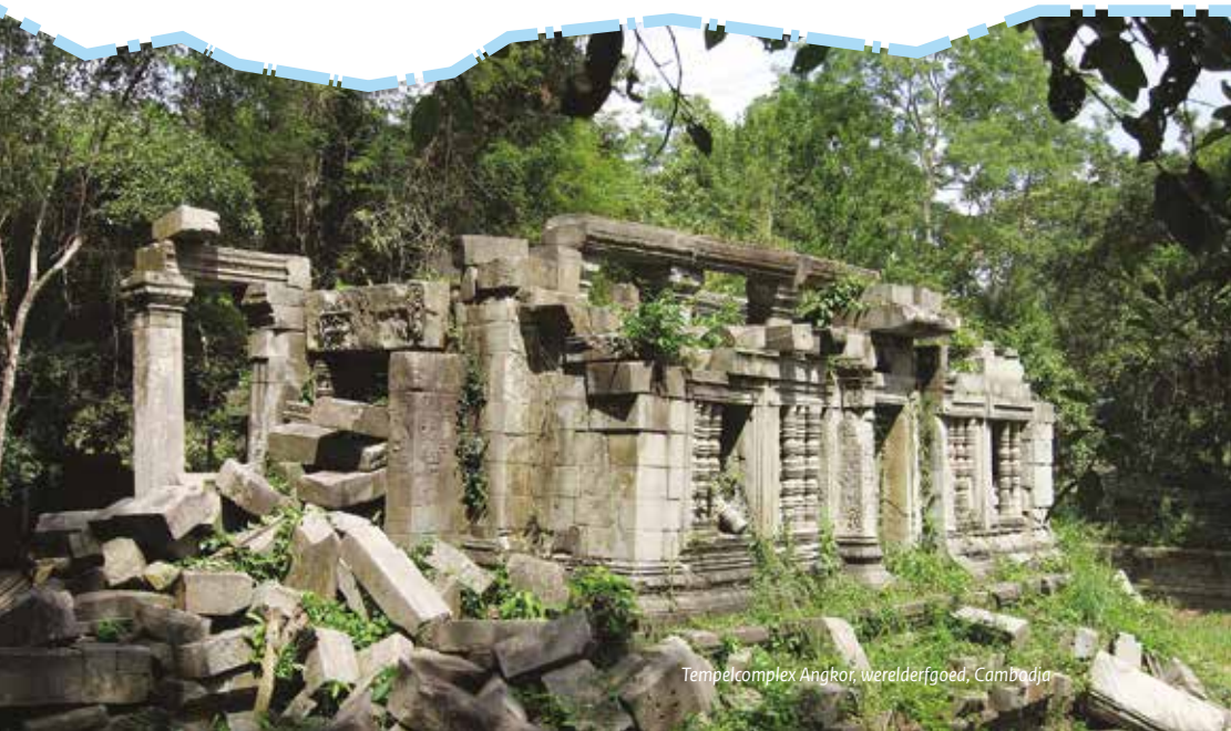
Tempelcomplex Angkor, werelderfgoed, Cambodja