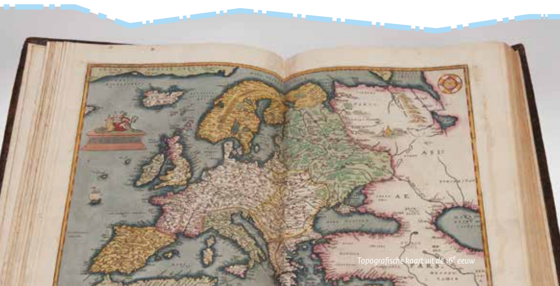
Topografische kaart uit de 16 e eeuw

© Ministerie van Onderwijs, Cultuur en Wetenschap | November 2016 | Publicatie-nr. o8BK2009Boz8