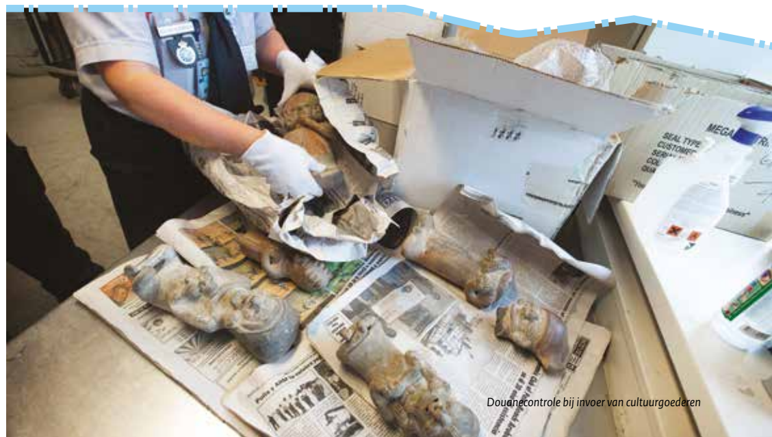
Douanecontrole bij invoer van cultuuroederen

Stel, uw beeld wordt aan de Nederlandse grens in bewaring genomen. U beroept zich erop dat u het beeld te goeder trouw heeft gekocht en meegenomen, want u had geen idee dat het een beschermd cultuurogoed was. Maar voor goede trouw is meer nodig dan goedgelovigheid. U moet alles doen wat redelijkerwijs van u verwacht kan worden om te ontdekken of een voorwerp een beschermd cultuurogoed is. Dit geldt voor alle manieren waarop u een cultuurogoed verwerft, ook via het internet. U moet ook kunnen aantonen dat u deze moeite heeft genomen (zie kader op volgende pagina). Kunt u dit aantonen, maar blijkt het voorwerp dat u wilt invoeren tóch beschermd te zijn, dan kunt u een beroep doen op goede trouw. Het voorwerp kunt u kwijtraken, maar u maakt aanspraak op een billijke vergoeding.