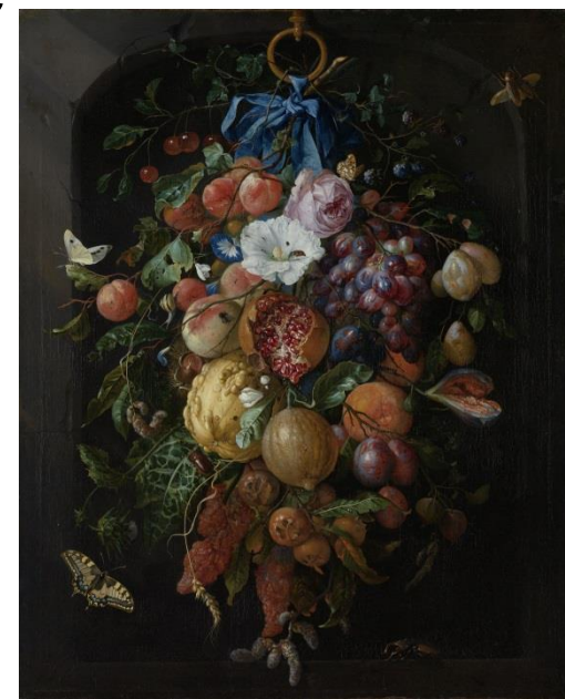
Jan Davidsz de Heem