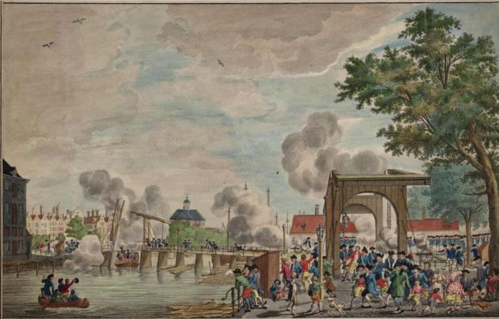
HET GEVEGT AANDE CATTENBURGERBRUG TEGENDE OR