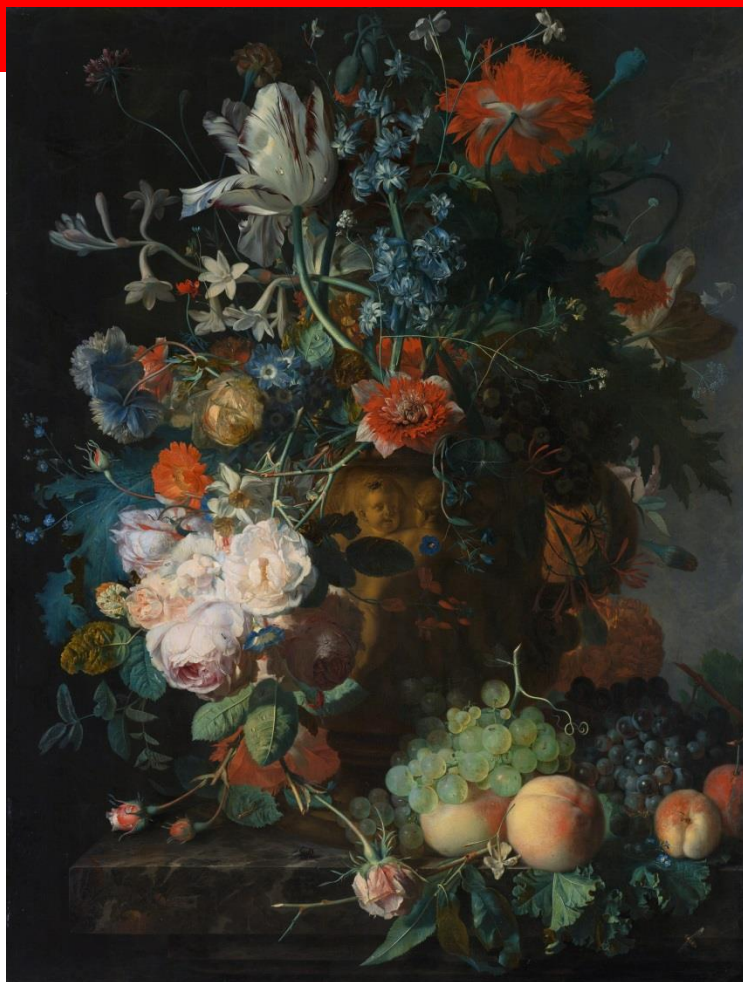
Jan van Huysum