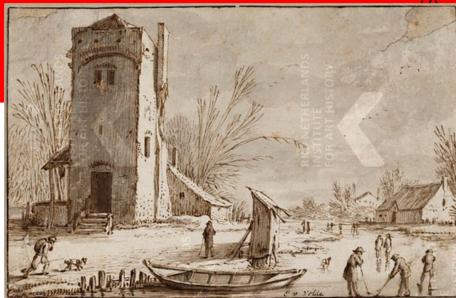
Van de Velde