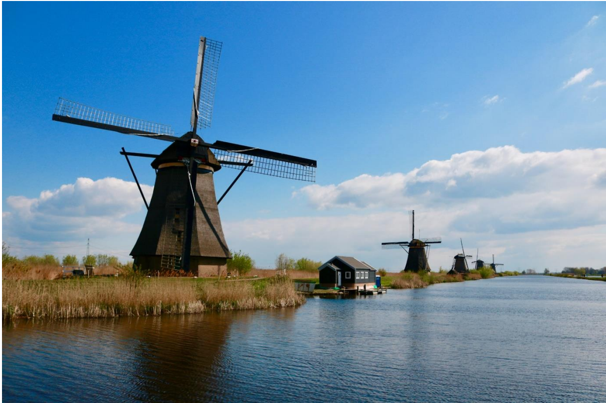
Molens bij Kinderdijk

te bereiken door actief stelling te nemen in voor Unesco relevante discussies en zo bij te dragen aan het maatschappelijk debat. Jongeren bereikt de Commissie met name door de activiteiten van, en in samenwerking met de Unesco Jongerencommissie.