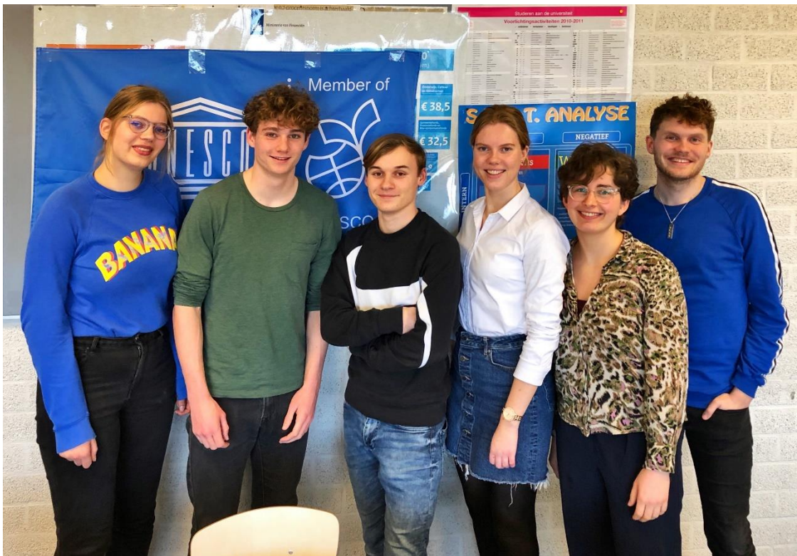
Deel van de Jongeren Commissie 2019-2020

Jongeren staan wereldwijd centraal in de programma's van Unesco. De Commissie wil nadrukkelijk ook jongeren een stem geven, en hun stem laten horen. Sinds 2018 heeft Nederland daarvoor een Unesco Jongerencommissie, bestaande uit 11 jongeren tussen 16-24 jaar oud. De Jongerencommissie geeft gastlessen, legt verbinding met andere Unesco-jongerencommissies en -organisaties en adviseert de Nederlandse Unesco Commissie. Daarnaast organiseert de Jongerencommissie zelfstandig acties en activiteiten, en werkt ze zoveel mogelijk samen met partners.